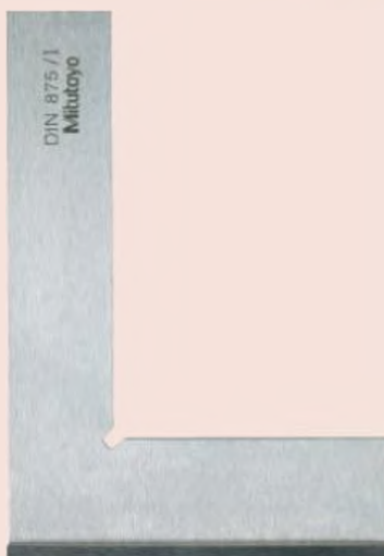
Поверочный угольник с буртиками